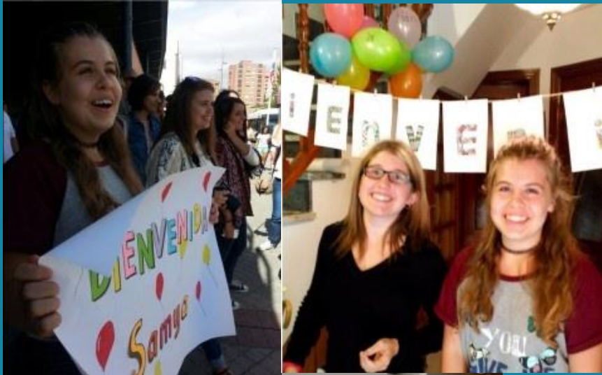
Mi primer día